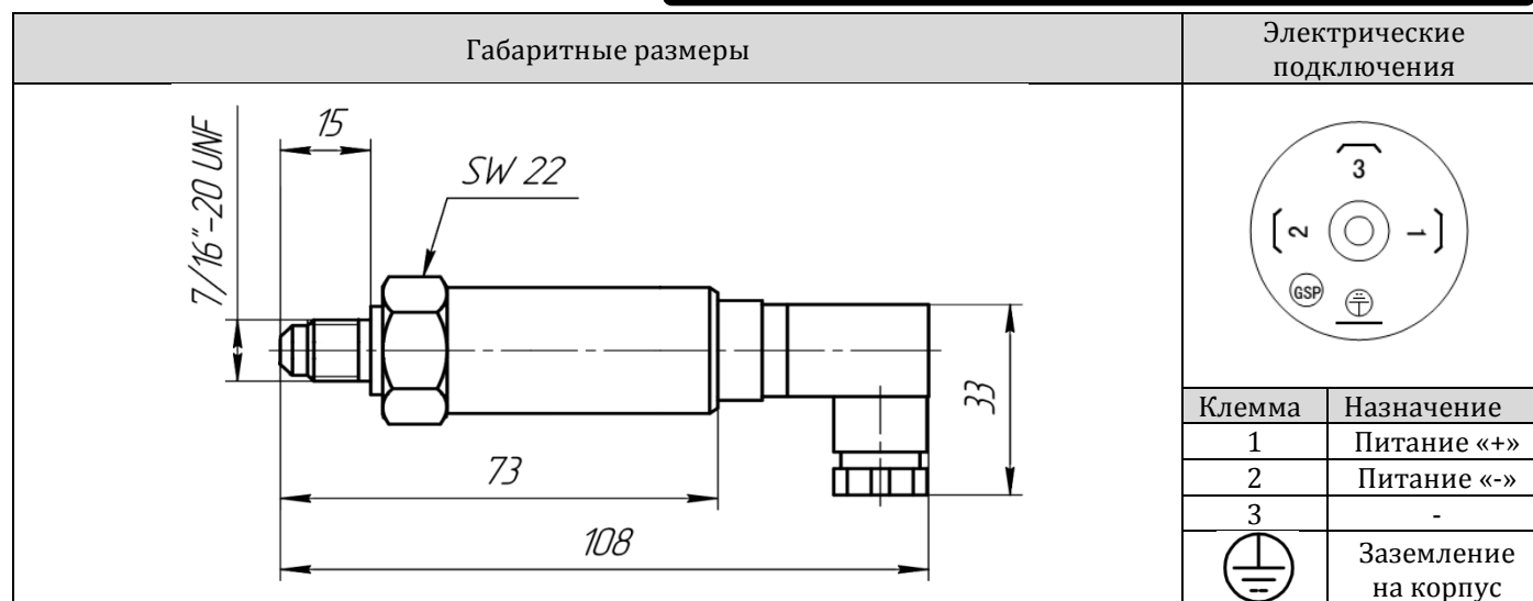
Табл.2. Габаритные размеры и электрические подключения